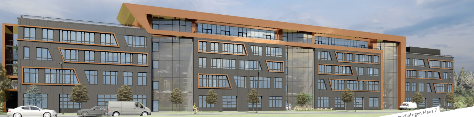
Visualisierung – Blick auf die Fassade vom zukünftigen Haus 7