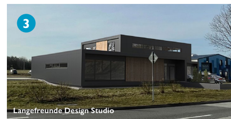
Langefreunde Design Studio

Ein weiteres Grundstück erwarb der Produktdesigner Felix Lange. Er ist als klassisches Ein-Mann Start-up vor 9 Jahren im TGZ gestartet und schafft nun eigene Räume für Ideen. Langefreunde hat als Full-Service Designagentur schon vielen Produkten, auch aus dem TGZ, ein neues ganzheitliches Design geben dürfen. Der