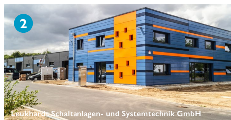
Leukhardt Schaltanlagen- und Systemtechnik GmbH

Mit dem Bau begonnen hat die Leukhardt Schaltanlagen- und Systemtechnik GmbH, welche seit 2018 im Technologiepark ansässig ist. Sie erweitert ihren