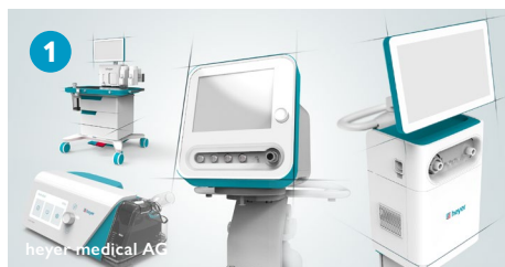
heyer medical AG

Das größte Grundstück auf dem TGZ-Gelände Schwerin hat die heyer medical AG erworben. Neben OP-Technik, bietet